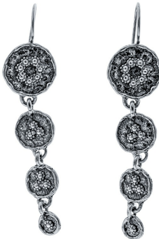
Серебряные серьги $ 26,00