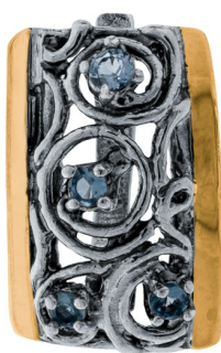
Серебряные серьги с золотом $ 50,00