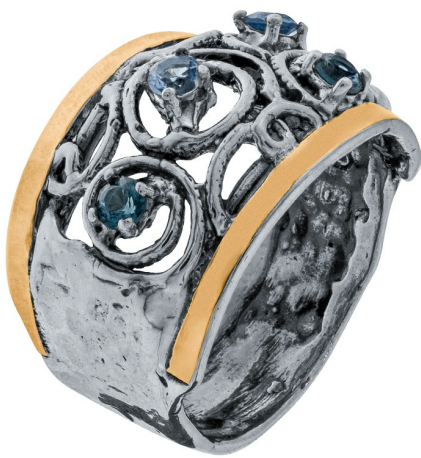
Серебряное кольцо с золотом $ 35,00