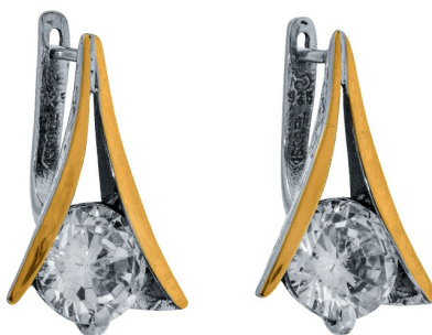
Серебряные серьги с золотом $ 44,00