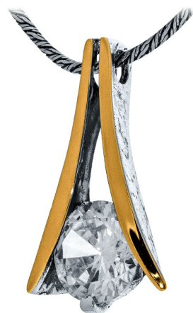
Серебряный кулон с золотом $ 19,00