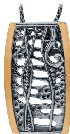
Серебряный кулон с золотом $ 40,00