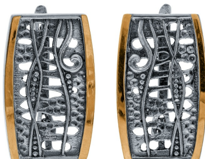
Серебряные серьги с золотом $ 56,00