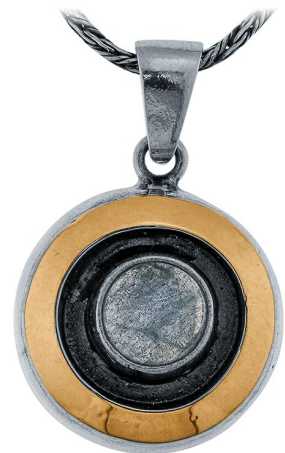
Серебряный кулон с золотом $ 34,00