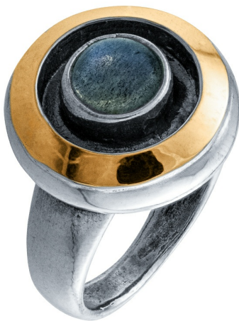
Серебряное кольцо с золотом $ 46,00