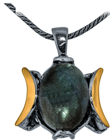
Серебряный кулон с золотом $ 38,00