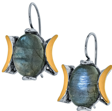
Серебряные серьги с золотом $ 68,00