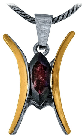
Серебряный кулон с золотом $ 18,00