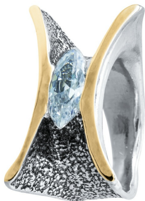
Серебряное кольцо с золотом $ 31,00