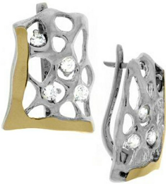
Silver and Gold Earrings $ 43,04