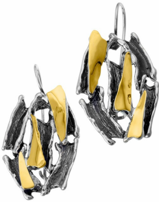
Silver and Gold Earrings $ 57,00