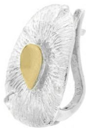
Silver and Gold Earrings $ 32,17