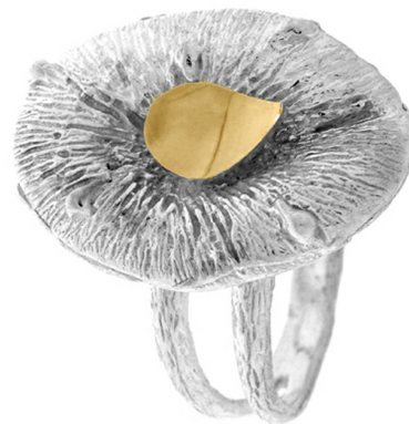
Серебряное кольцо с золотом $ 26,96