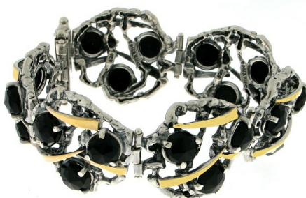
Silver and Gold Bracelet $ 177,83