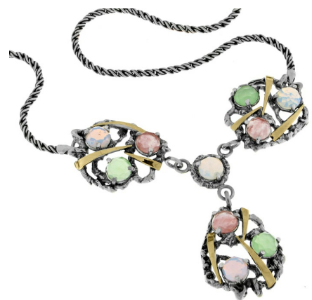
Silver and Gold Necklace $ 94,78