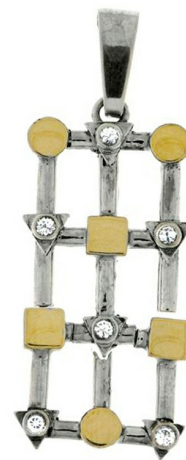
Silver and Gold Pendant $ 22,17