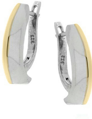
Silver and Gold Earrings $ 29,13