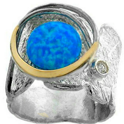
Серебряное кольцо с золотом $ 53,91