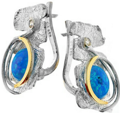
Silver and Gold Earrings $ 59,13