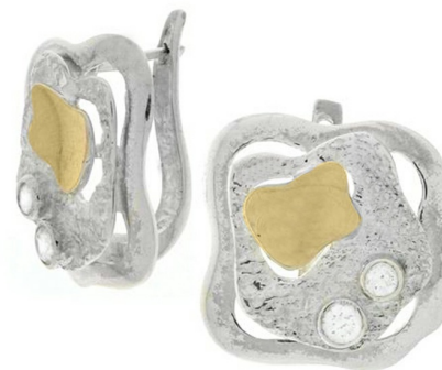
Silver and Gold Earrings 29.13 $