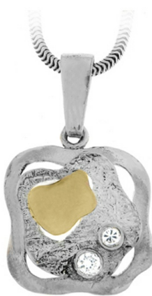
Silver and Gold Pendant 16.09 $