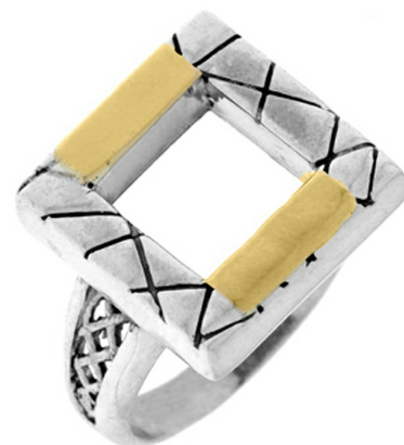
Open window 32.17 $