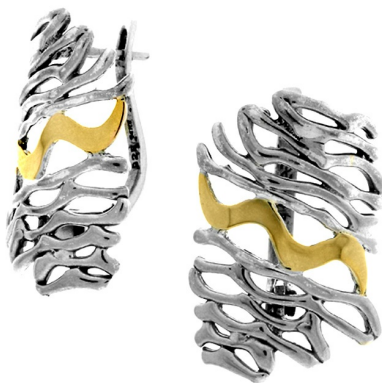
Silver and Gold Earrings 29.13 $