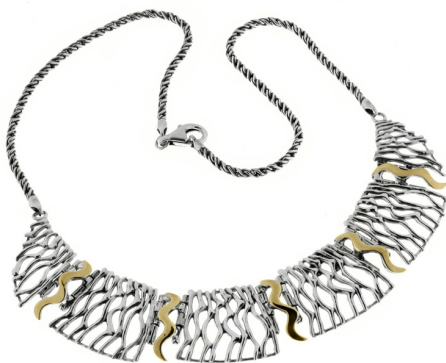
Silver and Gold Necklace 100.00 $