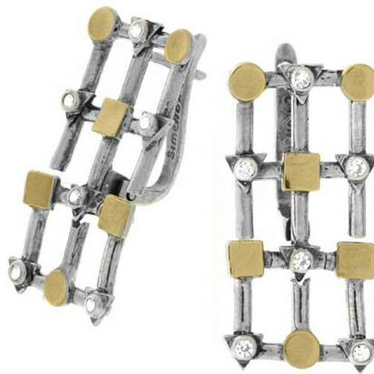
Silver and Gold Earrings 44.78 $