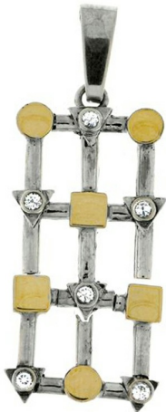
Silver and Gold Pendant 22.17 $