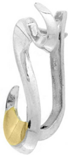
Silver and Gold Earrings 26.09 $