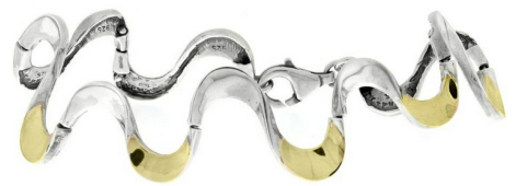
Silver and Gold Bracelet 65.22 $