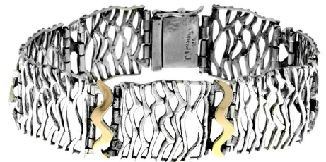
Silver and Gold Bracelet 114.78 $