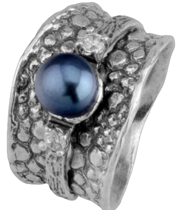
טבעת כסף 22.00 $