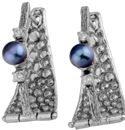
עגילי כסף 26.00 $