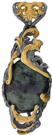
תליון כסף בציפוי זהב 50.00 $