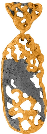
תליון כסף בציפוי זהב 46.50 $