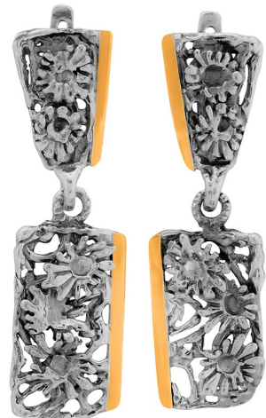
Silver and Gold Earrings 48.00 $