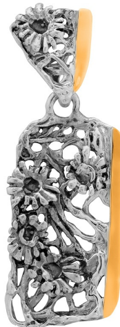
Silver and Gold Pendant 23.00 $