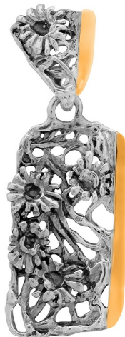
Silver and Gold Pendant 23.00 $