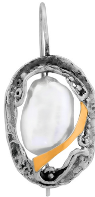
עגילי כסף עם זהב "אפרודיטה" 39.00 $