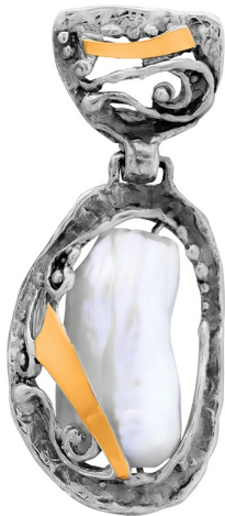
תליון כסף עם זהב "אפרודיטה" 30.00 $