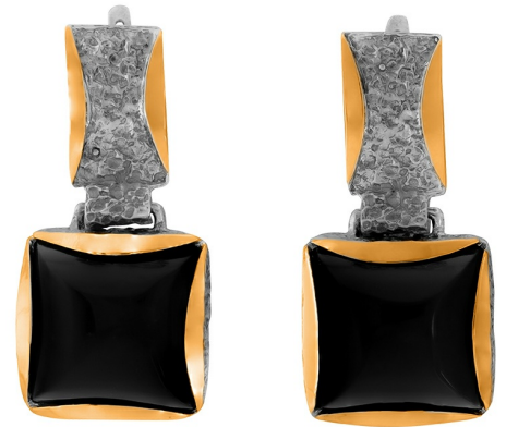
Silver and Gold Earrings 107.00 $