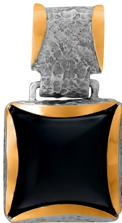
Silver and Gold Pendant 51.00 $