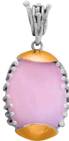
Silver and Gold Pendant 38.00 $