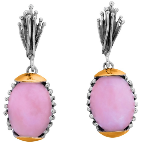
Silver and Gold Earrings 64.00 $