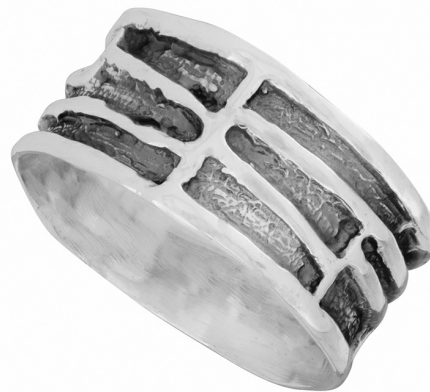
טבעת כסף 11.00 $