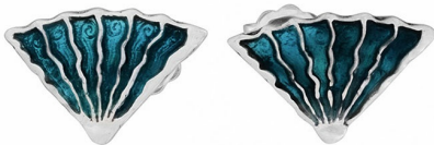
עגילי כסף עם אמיל "מדוזה" 15.00 $