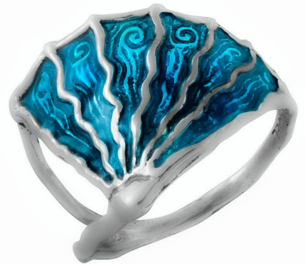
טבעת כסף עם אמיל "מדוזה" 16.50 $