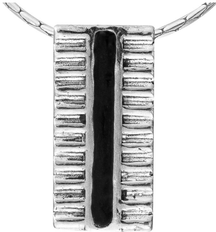
תליון כסף עם אמייל 10.00 $