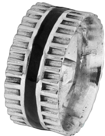
טבעת כסף עם אמייל 14.00 $