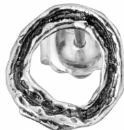
עגילי כסף 10.00 $