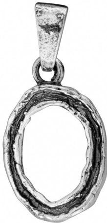
תליון כסף 10.00 $