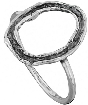
טבעת כסף 10.00 $