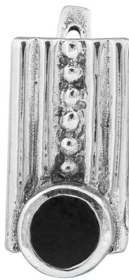
עגילי כסף עם אמייל 20.00 $