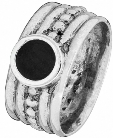
טבעת כסף עם אמייל 18.00 $