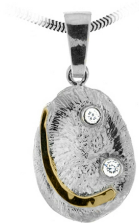
Silver and Gold Pendant 14.78 $