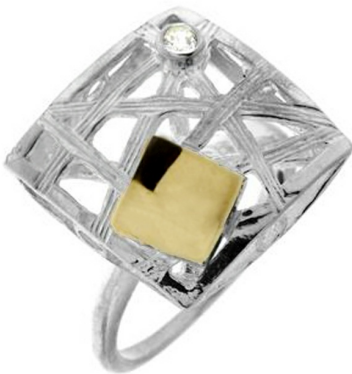
Silver and Gold Ring 17.83 $