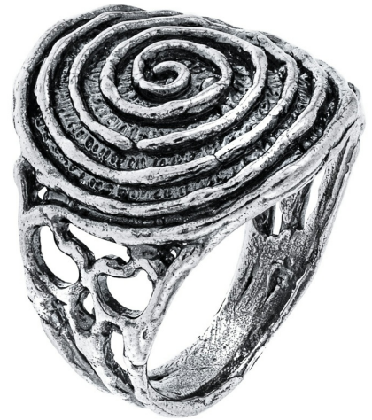
טבעת כסף 14.00 $