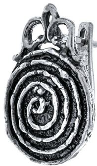
עגילי כסף 22.00 $