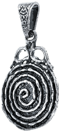
תליון כסף 10.00 $