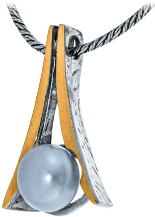
תליון כסף בשילוב זהב 19.50 $