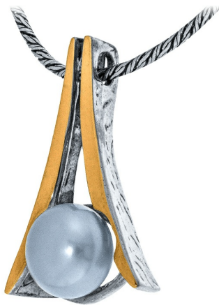
תליון כסף בשילוב זהב 19.50 $