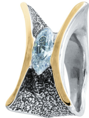
טבעת כסף בשילוב זהב 31.00 $