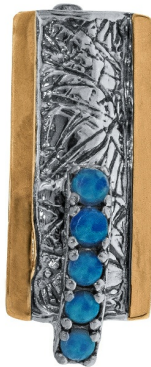
עגילי כסף בשילוב זהב 46.00 $