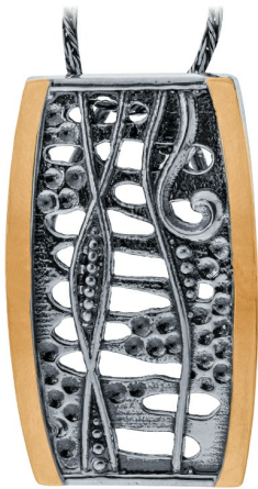
תליון כסף בשילוב זהב 40.00 $