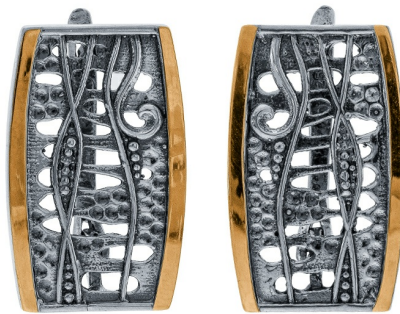
עגילי כסף בשילוב זהב 56.00 $