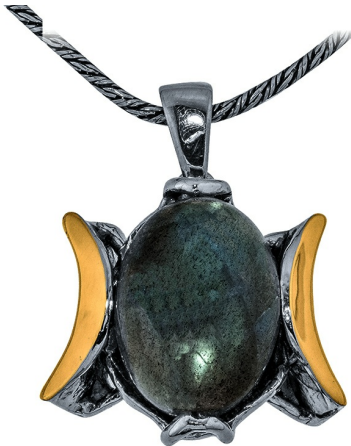
תליון כסף בשילוב זהב 38.00 $