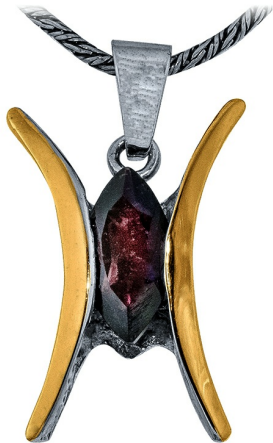
תליון כסף בשילוב זהב 18.00 $