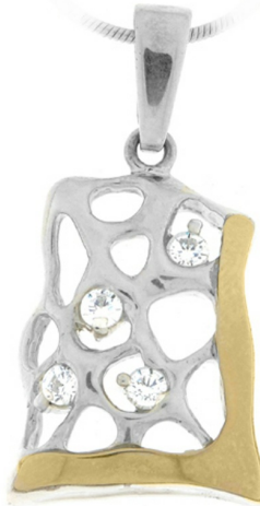
Silver and Gold Pendant 22.17 $