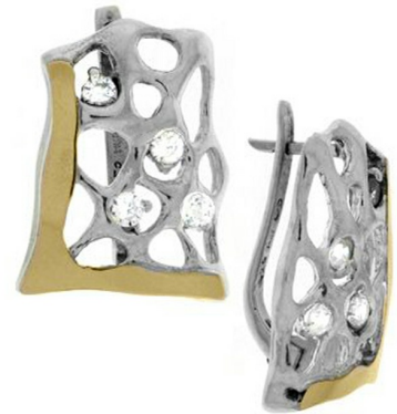
Silver and Gold Earrings 43.04 $