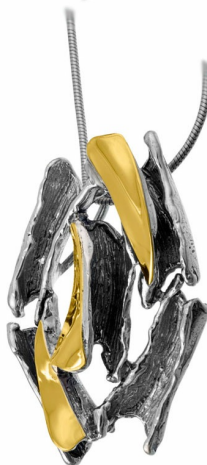
Silver and Gold Pendant 36.00 $