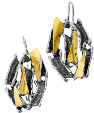
Silver and Gold Earrings 57.00 $