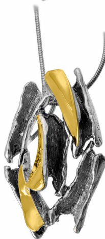
Silver and Gold Pendant 36.00 $