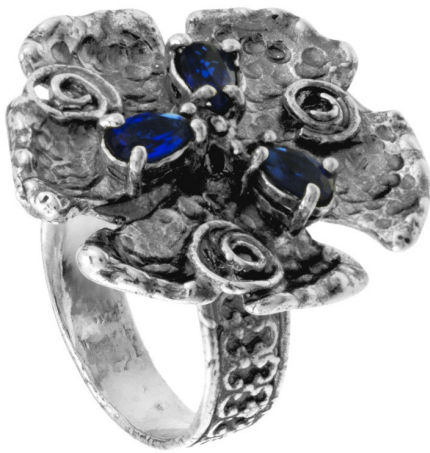
Silver Ring 22.17 $