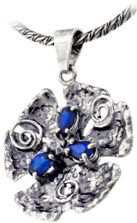
Silver Pendant 13.04 $