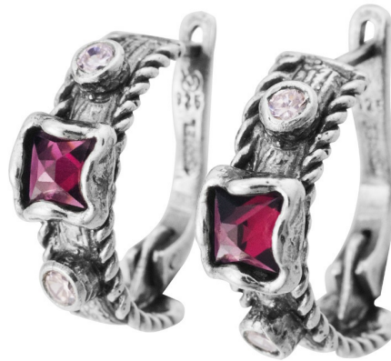
Silver Earrings 23.91 $