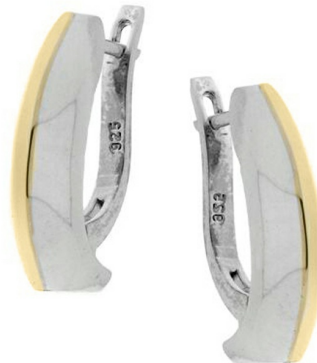
Silver and Gold Earrings 29.13 $