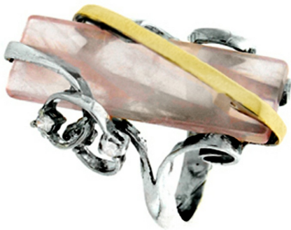
Silver and Gold Ring 26.09 $