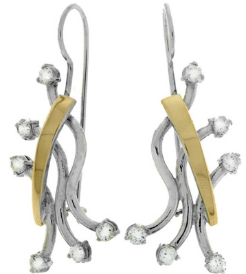
Silver and Gold Earrings 36.09 $